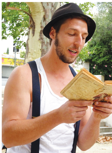
Conteur sur le marché