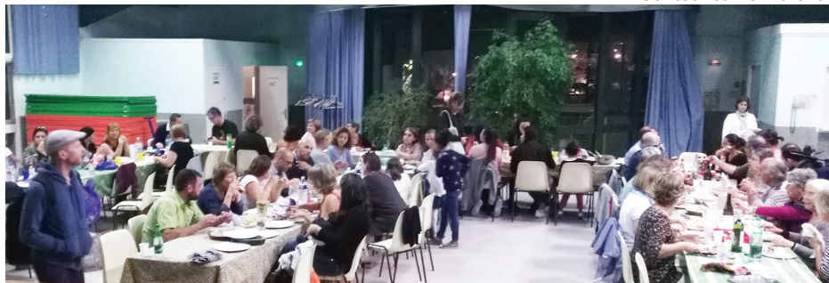
Repas de quartier