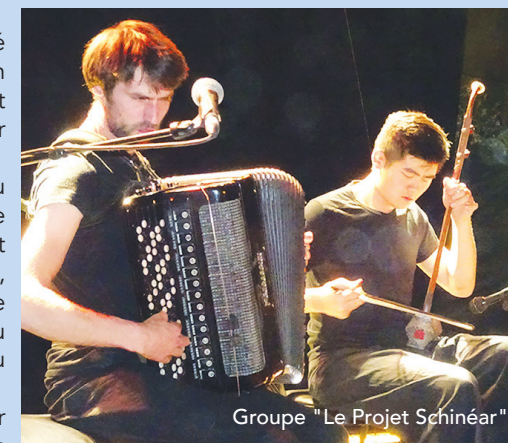
Groupe "Le Projet Schinéar"

Enfin, comme chaque année, le comité de quartier de Celleneuve est partenaire de l'événement.